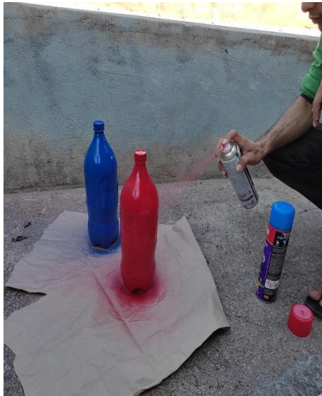
Fig. 1. Processo de pintura de armadilhas com tinta spray. Foto: Diego Brandão Mattos (2022)