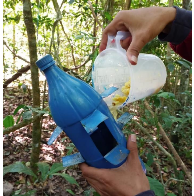
Fig. 2. Processo de instalação de armadilha para amostragem de besouros Histeridae (Coleoptera: Hydrophiloidea) em fragmento de floresta Amazônica. A isca utilizada é uma mistura de abacaxi com caldo de cana-de-açúcar previamente fermentados.