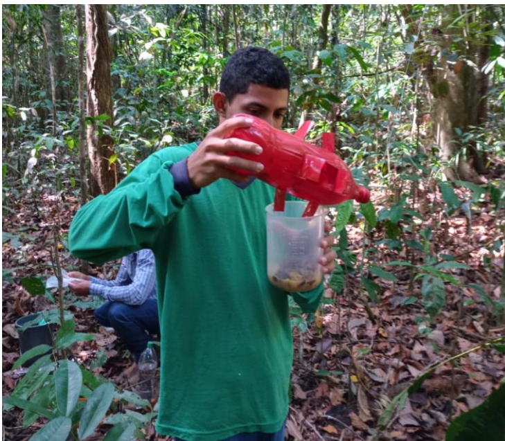
Fig. 3. Coleta dos espécimes de besouros Histeridae (Coleoptera: Hydrophiloidea) em fragmento de floresta Amazônica.

Foto: Luiz Filipe Ferreira Evangelista (2022)