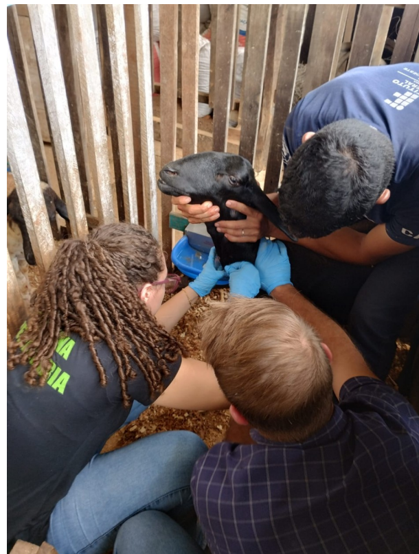
Fig. 2. Coleta de amostra de sangue.