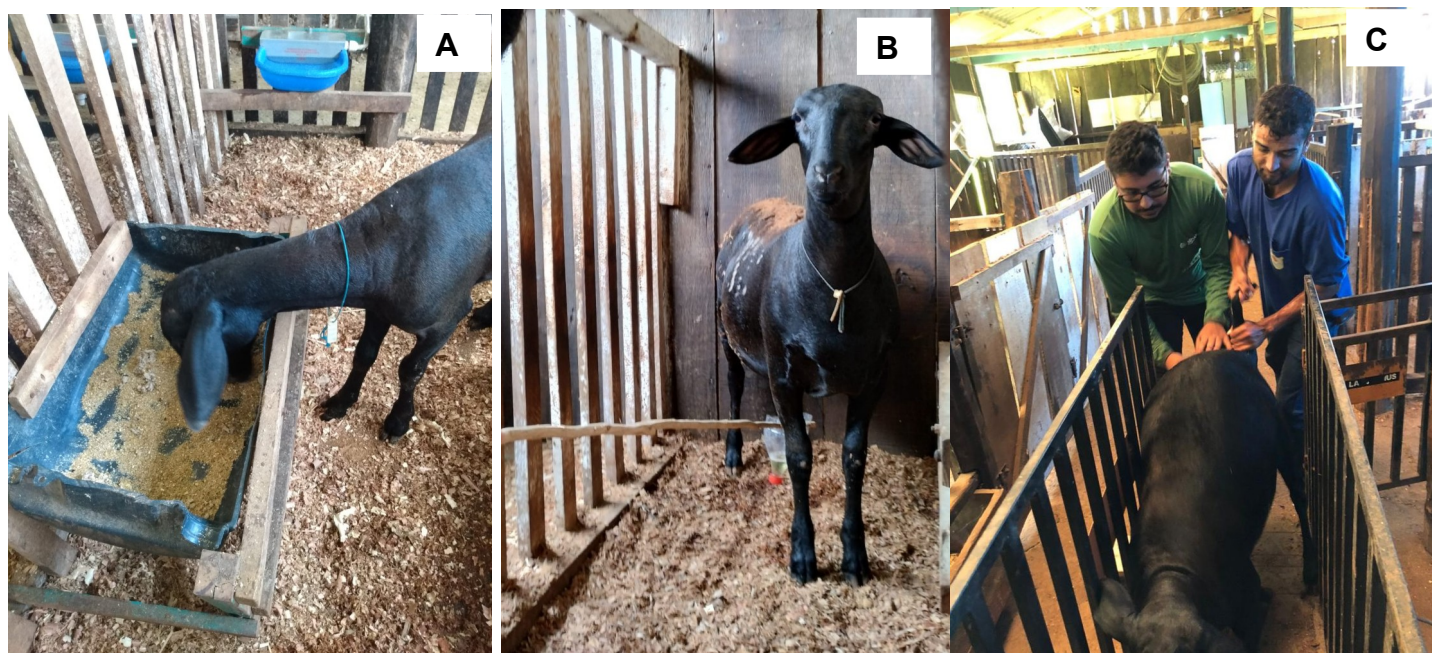
Fig. 3. Avaliação do consumo de nutrientes (A), coleta de amostras de urina (B) e pesagem de animais (C).