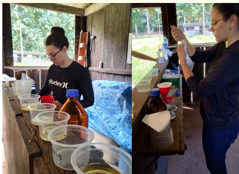
Fig. 1. Preparação de material para coleta.